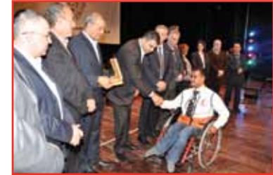
المهرجان الوطني لتكريم المتطوعين الفلسطينيين / عونه 2010 - رام الله