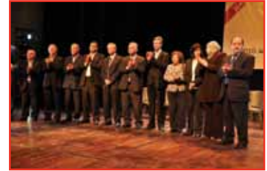
المهرجان الوطني لتكريم المتطوعين الفلسطينيين / عونه 2010 - رام الله