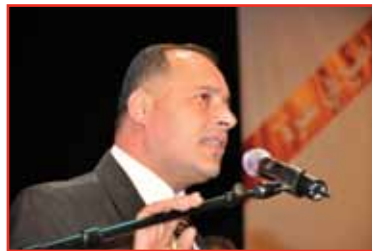
المهرجان الوطني لتكريم المتطوعين الفلسطينيين / عونه 2010 - رام الله

للاستفسار يرجى الاتصال على سكرتاريا اللجنة الوطنية للمهرجان الوطني لتكريم المتطوعين - منتدى شارك الشبابي هاتف: 02-2967741 - أو عبر البريد الإلكتروني: info@sharek.ps